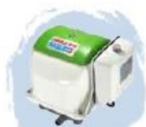
Version AL Modèle avec coffret d'alarme